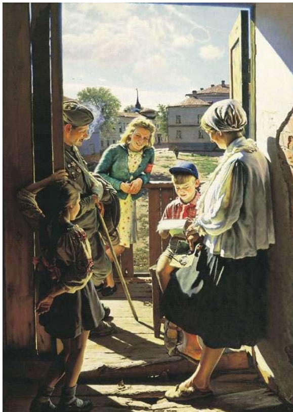
Картина «Письмо с фронта», художник А.И. Лактионов